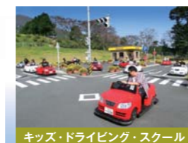
キッズ・ドライビング・スクール